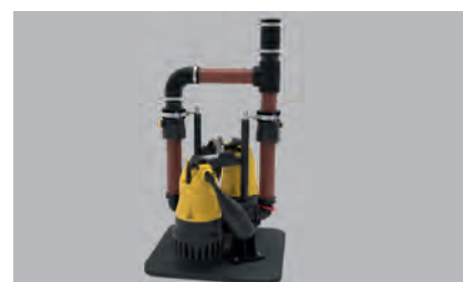
Čerpadla nejsou součástí dodávky