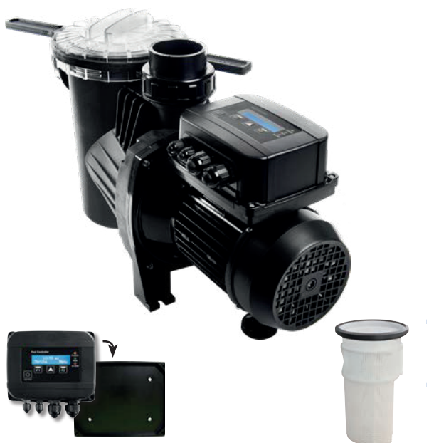
Volitelně držák na stěnu Wall support as an option Soporte de pared opcional Support mural en option