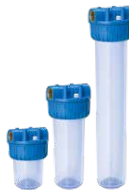
FILTR 5", 9 3/4", 20"

Filtry mechanických nečistot pro čerpadla a vodárny. Hlava filtru z polypropylénu, připojení z mosazi, o-kroužek z NBR. Max. pracovní tlak: 7 bar, teplota vody: 1°C až 45°C. Verze DUPLEX, TRIPLEX a TRIPLEX bílý s UV ochranou. Na vyžádání možnost i modré neprůhledné nádoby s UV ochranou, která zabraňuje růstu bakterií, pro venkovní použití.