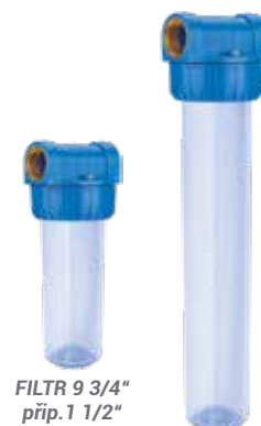
FILTR 9 3/4" přip. 1 1/2"

Filtry mechanických nečistot pro čerpadla a vodárny. Hlava filtru z polypropylénu, připojení z mosazi, o-kroužek z NBR. Max. pracovní tlak: 9 bar, teplota vody: 1°C až 45°C.