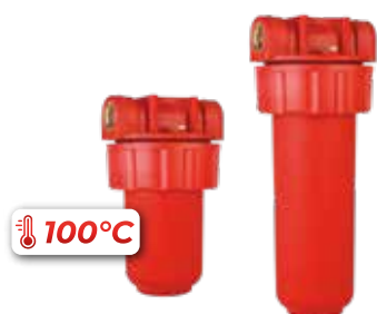
FILTR HOT 5", 9 3/4"