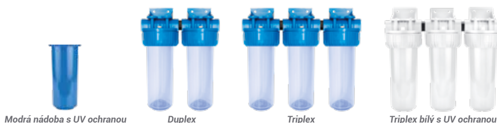
Modrá nádoba s UV ochranou